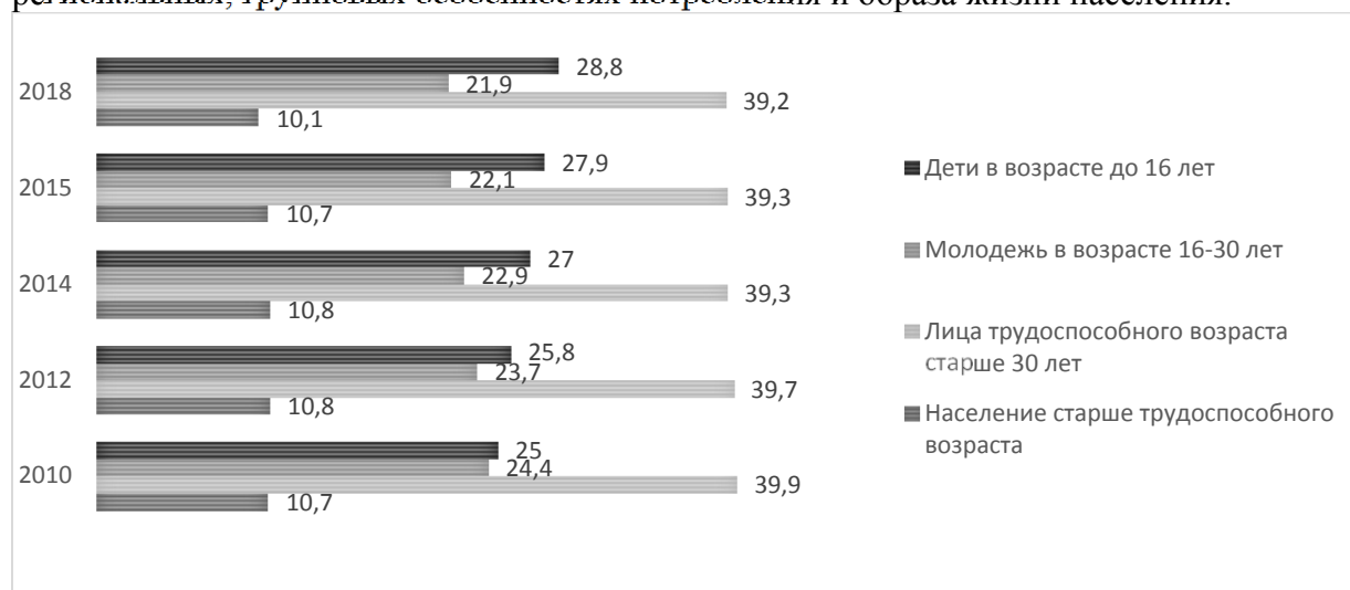
Рис. 3. Распределение населения с денежными доходами ниже величины ПМ по основным возрастным группам, %

– процедуру разработки научно обоснованных норм потребления товаров продовольственной корзины проводить на региональном и даже местном уровнях, что обусловит более точный учет всех факторов и усиление адресного характера последующих мер. Статистические данные необходимо дополнять информацией о региональных, групповых особенностях потребления и образа жизни населения.